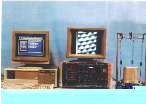
电化学扫描隧道显微镜仪器照片